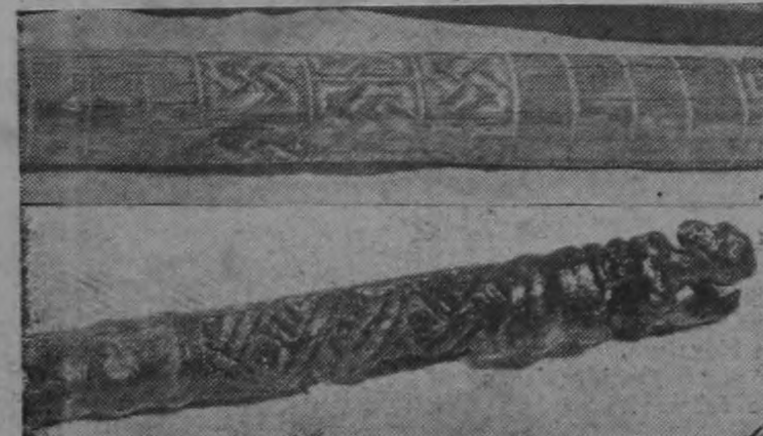
Dos de los valiosos bastones de madera que se encuentran por primera vez en Costa Rica, que presentan decoraciones incisas geométricas.