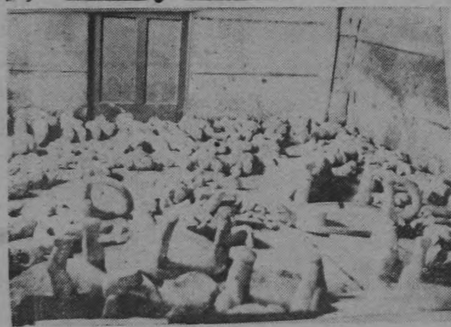
Una parte de las piezas de piedra que componen el hallazgo arqueológico hecho en Llano Grande de Cartago. Puede observarse el número grande de figuras humanas.